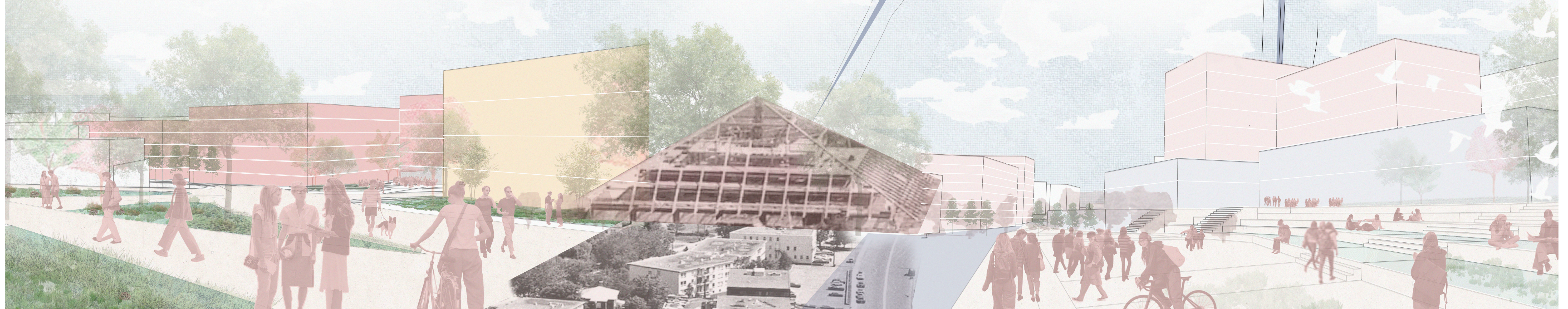
Collage de l'entrée du Cégep de Sainte-Foy | Place publique à la fin de l'allée des cégeps